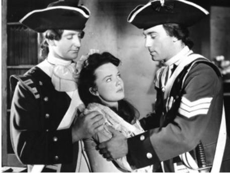
1951 LE CHEVALIER AU MASQUE DE DENTELLE (The Highwayman) de Lesley Selander