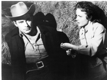
1954 LE TRAITRE DU DAKOTA (The black Dakotas) de Ray Nazarro avec John Bromfield