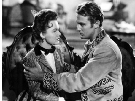
1951 MON FRÈRE LE HORS-LA-LOI (My Outlaw Brother) d'Elliott Nugent avec Robert Stack