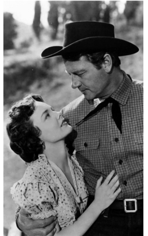
1950 LE VAGABOND ET LES LUTINS (Saddle Tramp) de Hugo Fregonese avec Joel McCrea