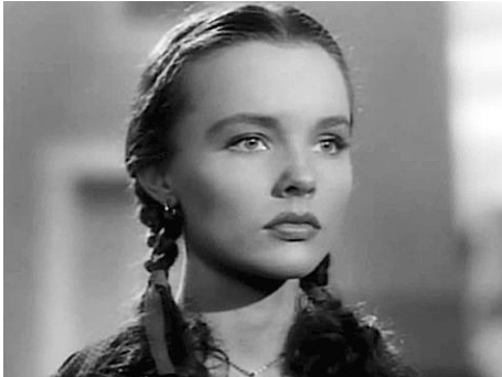
1946 L'AMANT SANS VISAGE (Nora Prentiss) de Vincent Sherman