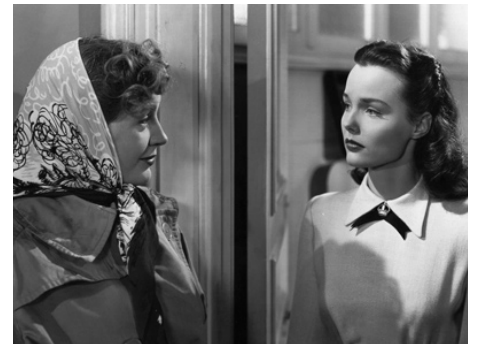
1948 MON VÉRITABLE AMOUR (My Own true Love) de Compton Bennett avec Binnie Barnes