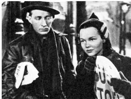
1947 LE DOCTEUR ET SON TOUBIB (Welcome Stranger) d'Elliott Nugent avec Bing Crosby