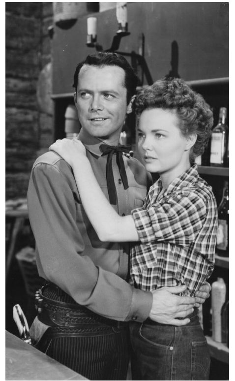
1952 MONTANA TERRITORY de Ray Nazarro avec Ion McAllister