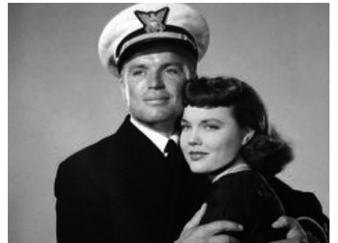
1953 LA MER DES BATEAUX PERDUS (Sea of lost Ships) de Joseph Kane avec Richard Jaeckel