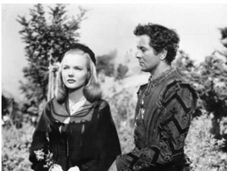
1949 ÉCHEC À BORGIA (Price of Foxes) de Henry King avec Tyrone Power