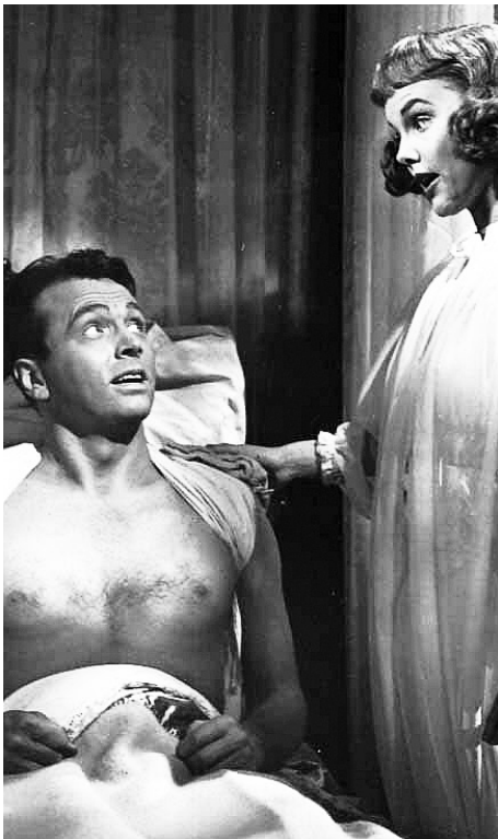
1948 LA CHASSE AUX MILLIONS (Miss Tatlock's Million) de Richard Haydn avec John Lund