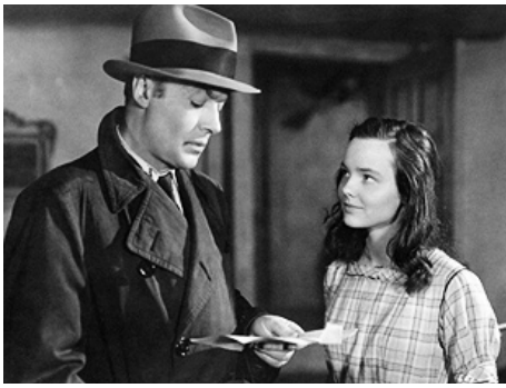
1945 AGENT SECRET (Confidential Agent) de Herman Shumlin avec Charles Boyer