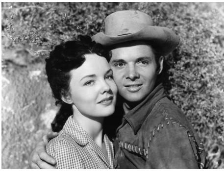
1950 LA TÊTE D'UN INNOCENT (Sierra) d'Alfred E. Green avec Audie Murphy