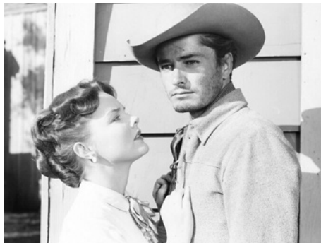
1953 LA DERNIÈRE CHEVAUCHÉE (The last Posse) d'Alfred L. Werker avec John Derek