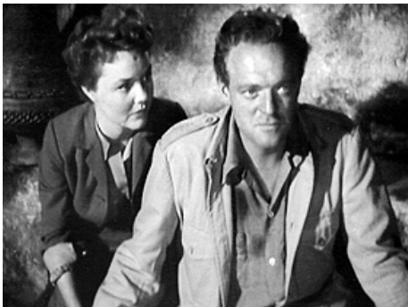
1952 AU SUD D'ALGER (South of Algiers) de Jack Lee avec Van Heflin