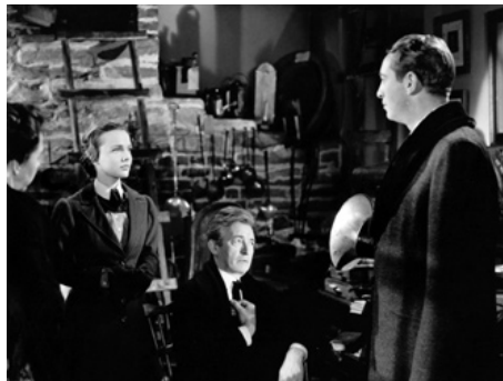
1949 PÉCHÉ DE JEUNESSE (Song of Surrender) de Mitchell Leisen avec Claude Rains, Macdonald Carey