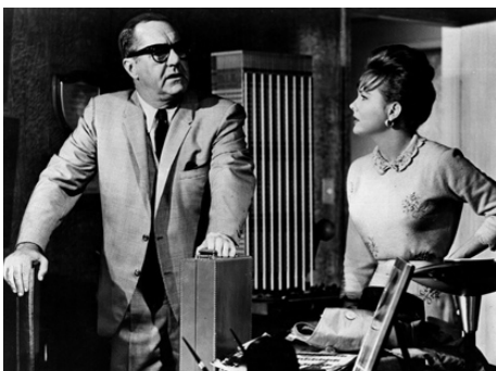
1962 LA REVANCHE DU SICILIEN (Johnny Cool) de William Asher avec Jim Backus