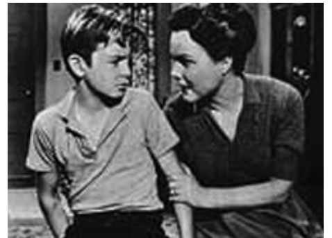
1960 BOY WHO CAUGHT A CROOK d'Edward L. Cahn avec Roger Mobley