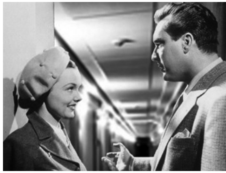
1950 L'AMIRAL ÉTAIT UNE DAME (The Admiral was a Lady) d'Albert S. Rogell avec Edmond O'Brien