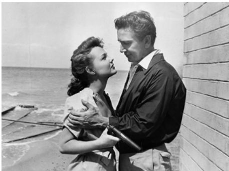
1954 LA TUEUSE DE LAS VEGAS (Highway Dragnet) de Nathan Juran avec Richard Conte